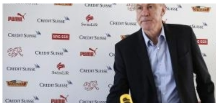
Hitzfeld sucht den Ruhestand: Nach WM ist Schluss