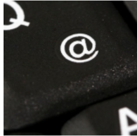
IBM kämpft mit anhaltend schwachem Geschäft