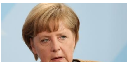
Nach Erdbeben: Merkel bietet Philippinen Hilfe an