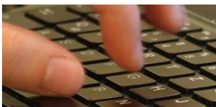
Studie: Viele Personaler informieren sich im Internet