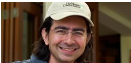
Verleger 2.0: Internet-Milliardäre entern das