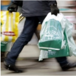
Versandhändler Otto ist zum Internet-Unternehme...