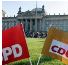
Verhandlungskreise: Union und SPD für Koalition...